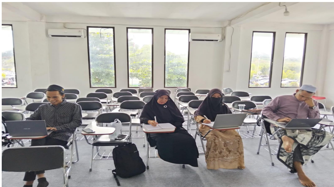
Gambar 1. Proses Pembelajaran Insyā' Tahriīr di Kelas